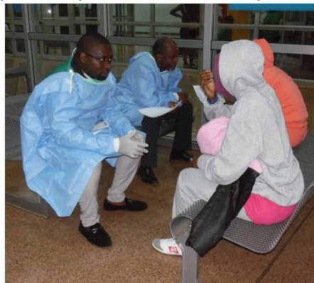
Screening médical à l'arrivée, Yaoundé, 5 février 2018

d'une consultation médicale rapide et d'une prise en charge psychologique à leur arrivée. Ceux qui présentent un état de santé préoccupant sont transportés