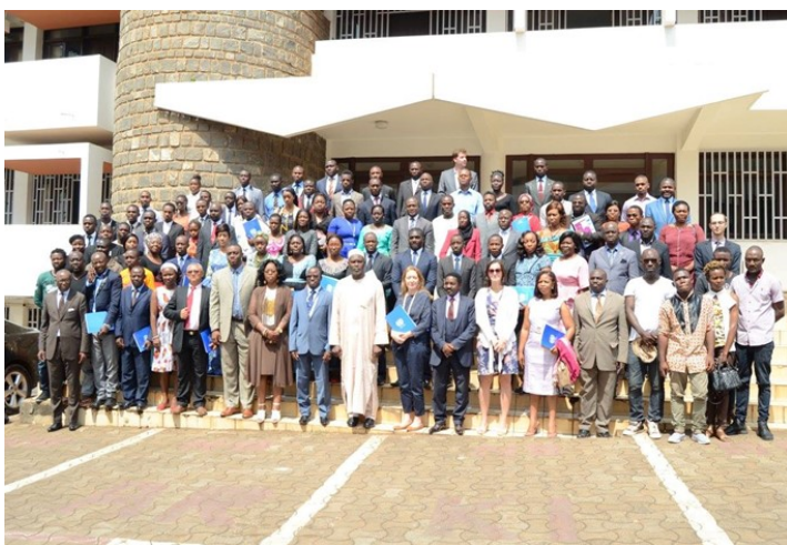
Photo de famille après la cérémonie solennelle d'ouverture

c'est pourquoi deux activités artistiques furent intégrées à la conférence: la diffusion d'un film sélectionné dans le cadre du Festival international du Film sur la Migration 2017 intitulé « Wallah Je Te Jure » et une exposition d'œuvres picturales traitant des illusions et désillusions relatives à la migration irrégulière. Le film a su provoquer des réactions aussi diverses que variées auprès de son audience du jour, entre moments de rire et de tristesse, tout en permettant une approche sérieuse et vraie de ce que représente le parcours des migrants subsahariens, hommes et femmes, qui empruntent les voies de migrations non officielles.