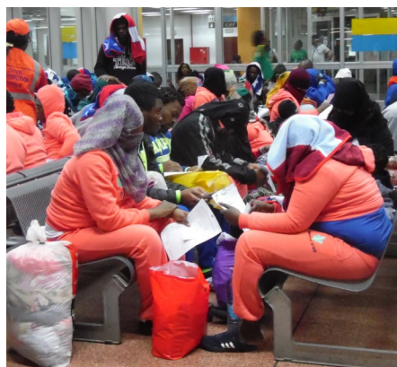
Enregistrement à l'arrivée, Yaoundé, 5 février 2018

d'urgence pour obtenir les soins appropriés. Après une première nuit prise en charge par l'OIM, les migrants reçoivent 65000 FCFA pour voyager jusqu'à leur village et couvrir leurs besoins immédiats. Dans les semaines qui suivent leur retour, ils sont encouragés à passer au bureau OIM le plus proche de chez eux pour dé-